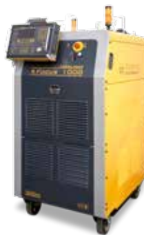
Kjellberg XFocus 1000

Tous les paramètres de coupe laser, comme la pression des gaz, distance de coupe, réglage de la focalisation de la tête sont appelés par une simple pression sur une touche.