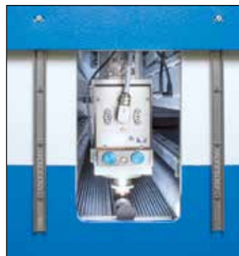
Trappe de maintenance