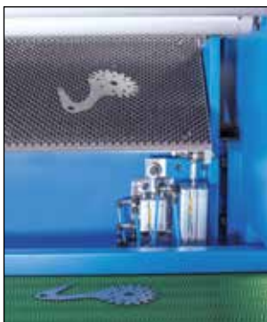
Trappe d'évacuation des pièces

Cela lui procure un positionnement rapide et précis.