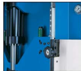
Vérin 28 tonnes