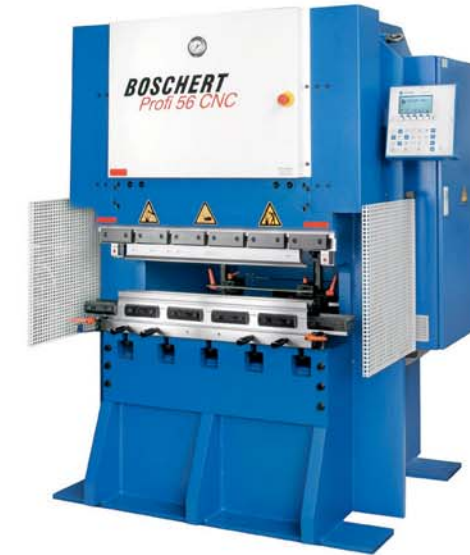
Profi 56/1000 CNC

En plus de la programmation des butées de profondeur ce modèle permet aussi de programmer les angles. BOSCHERT attache une grande importance à la facilité d'utilisation de ses machines. Par exemple, il est possible en mode manuel, avec seulement 4 lignes de plier une tôle complète.