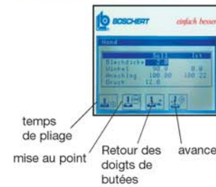
temps de pliage mise au point Retour des doigts de butées avance

Par une fonction TEACH-IN, il est possible de stocker en mémoire définitivement la spécificité de la matière. Ce système permet d'échapper aux essais de pliage habituels. Selon besoin un appui sur l'une des touches ci-dessous permet d'utiliser d'autres fonction importantes.