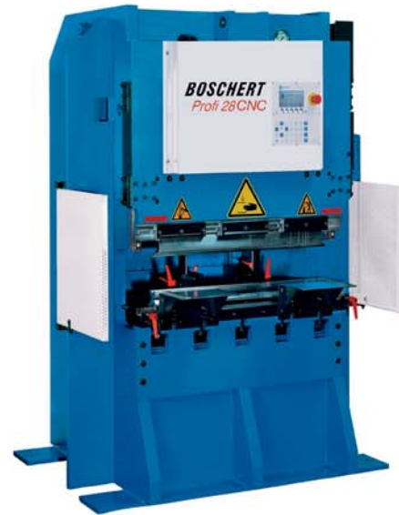
Profi 28/1000 CNC