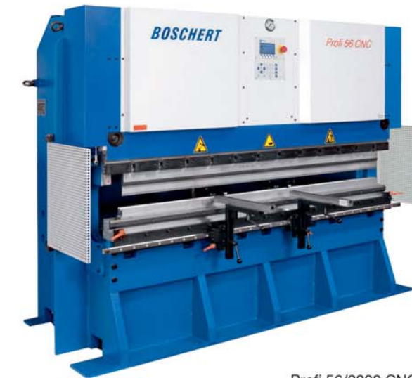
Profi 56/2200 CNC