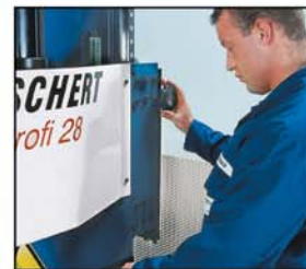
profondeur pliage réglable sous pression