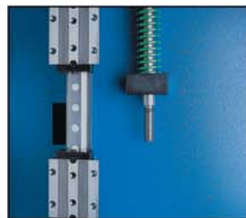
double guidage de chaque côté

Les butées de profondeur (axe x) peuvent être programmées (jusqu'à 99 programmes de 30 lignes chacun).