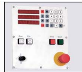
Commande gérant jusqu'à 99 programmes