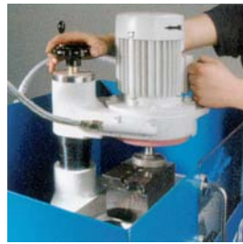
Utilisation très conviviale