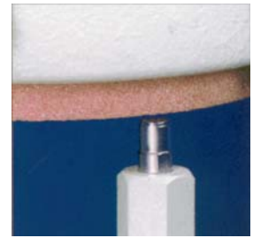
Affûtage de la meule par diamant