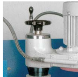
Réglage précis de la hauteur